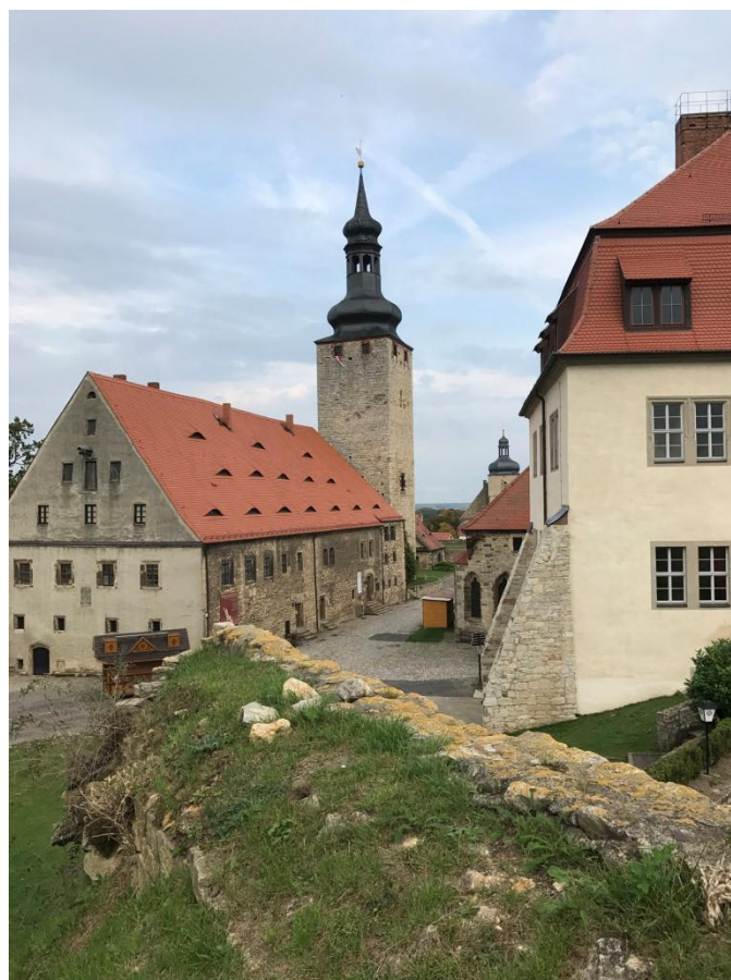
Querfurt, à l'intérieur du château médiéval.

De retour à Roßleben, une halte pour visiter la ville historique de Querfurt.