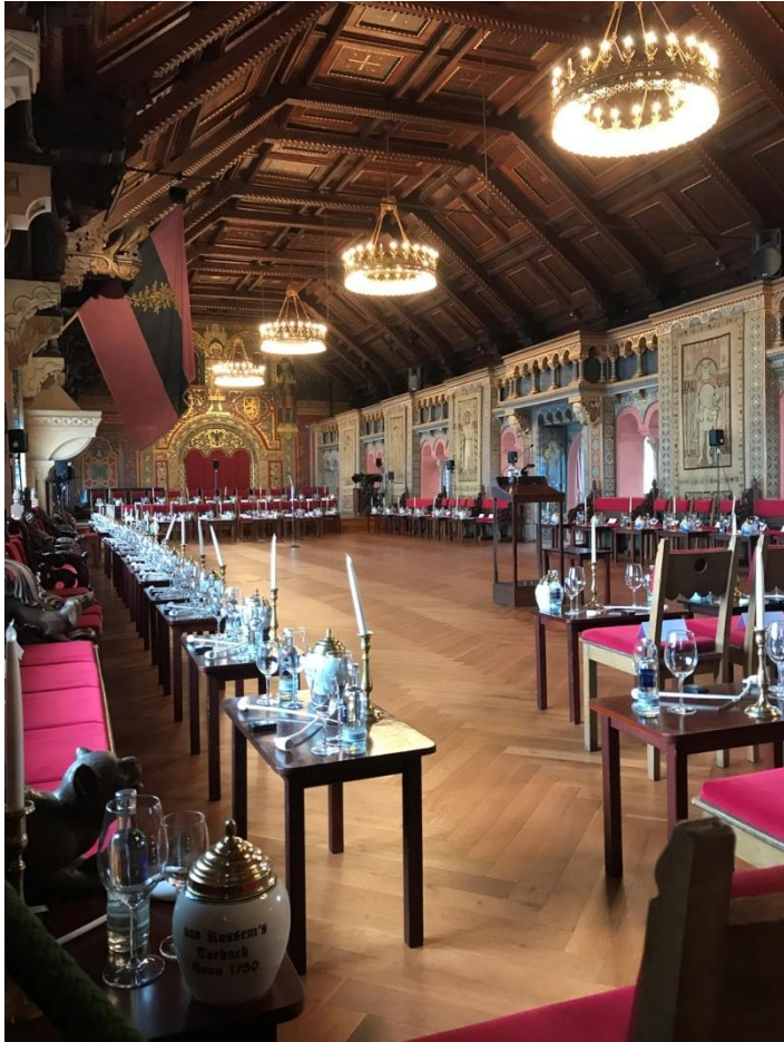
Grande salle d'apparat au dernier étage de la Wartburg, prête pour le tournage d'un film.