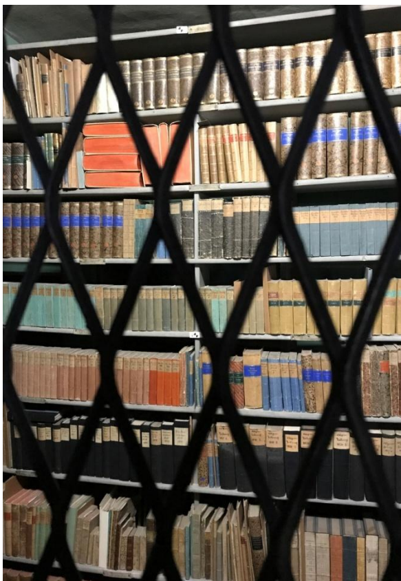
Une partie de la bibliothèque du grand homme.