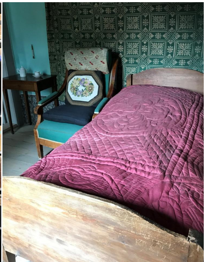
La chambre où Goethe est mort, le 22 mars 1832.