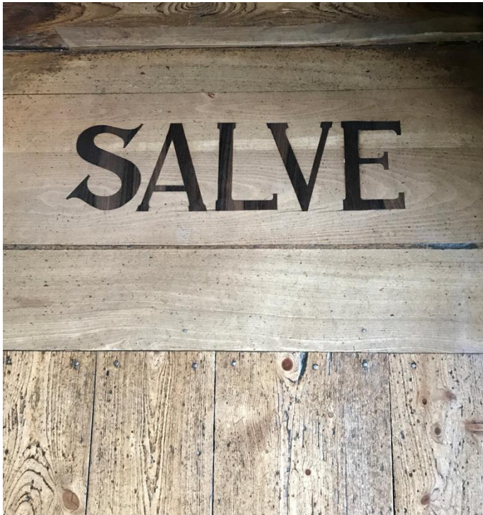
Le seuil de la maison de Goethe, désormais l'un des plus célèbres musée de l'Allemagne.

Weimar : la journée du 27 septembre est consacrée à la visite de la ville de Goethe et de Schiller.