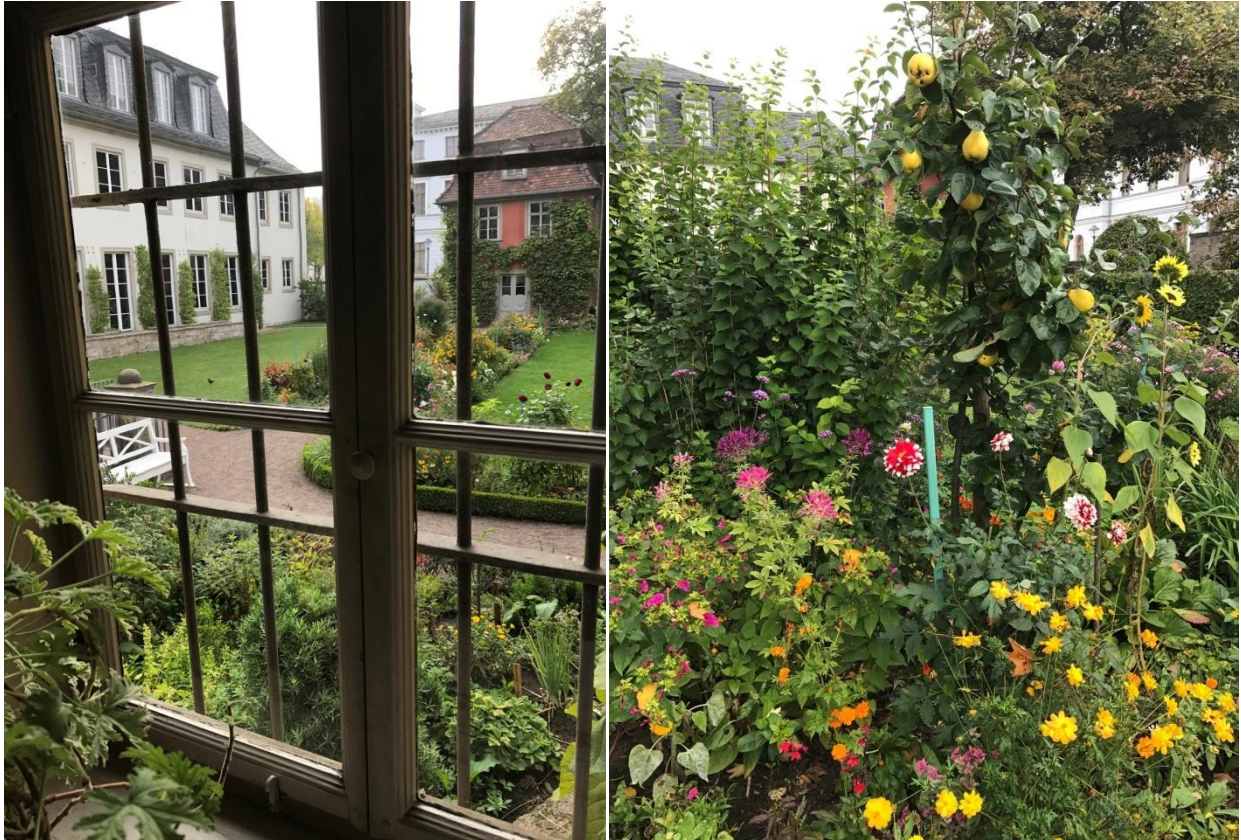
Le jardin de la maison de ville de Goethe.