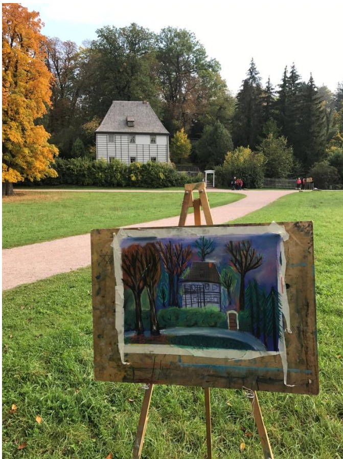
La maison des champs de Goethe, dans le parc de Weimar. Au premier plan la réalisation d'une élève des Beaux-arts.