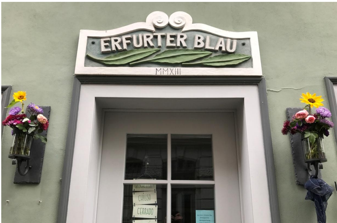
Erfurt, sur le Krämerbrücke.

Roßleben, petite ville de quelque 5000 habitants, est surtout connue pour son école, la Klosterschule qui nous accueille. Elle conserve encore de nombreux vestiges de la DDR.